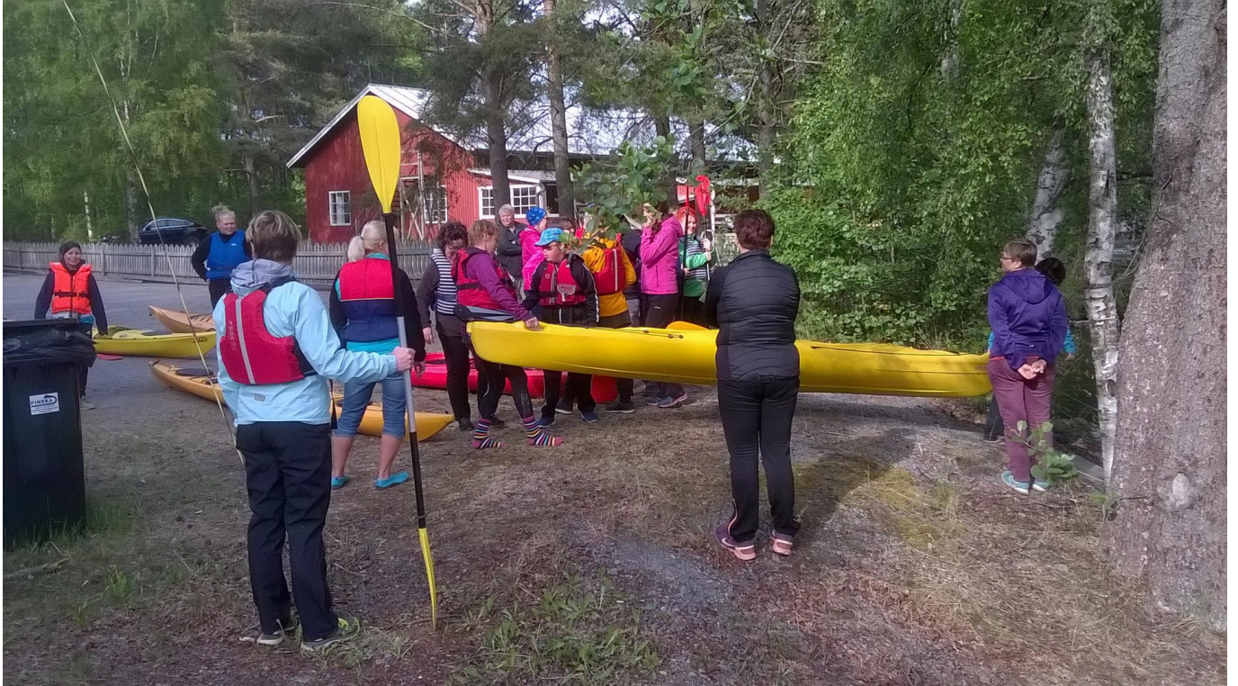
Kuva: Tutustu melontaan -päivä. Kajakit on ollut helppo siirtää varastosta vesille.

Vammalan Retkeilijöiden nykyinen kajakkivarasto ja Melontakeskus sijaitsee Siikasuolla, ennen Tervakallion leirintäaluetta, osoitteessa Uittomiehenkatu 23, 38210 Sastamala . Paikka on vanha Uittoyhdistyksen tiilirakennus. Yhdistys on vuokrannut tilan Sastamalan kaupungilta. Vuokrasopimuksemme sanottiin irti ja uudessa sopimuksessa vuokra on yli 5-kertainen vanhaan sopimukseen verrattuna. Uusi vuokrasopimus astui voimaan 1.9.2024. Yhdistys on saanut paikalliselta yksityisyrittäjältä sponsoritukena loppuvuoden vuokran, mutta kovin kauaa ei yhdistyksemme voi kallista varastotilaa pitää. Omavarainhankintaa on tehostettava ja jatkossa yhdistyksemme on hinnoiteltava palvelut, joita toistaiseksi olemme tarjonneet maksutta.